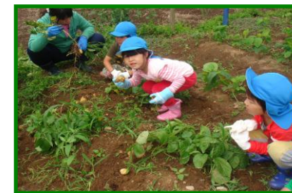
★じゃがいも掘り★みんなで、たくさんのじゃがいもを頑張って掘りました。お手伝いありがとうございました。