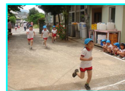
★第一回マラソン大会★最後まで頑張りました！！応援ありがとうございました。