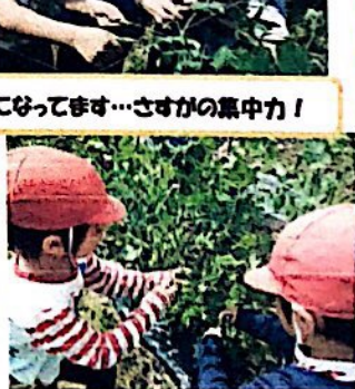
夢中になってます…さすかの集中力！