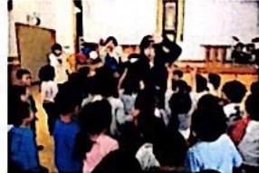
綺麗なピアノ演奏を聞いたり、手遊びや歌を一緒に歌ったり楽しい時間でした♪