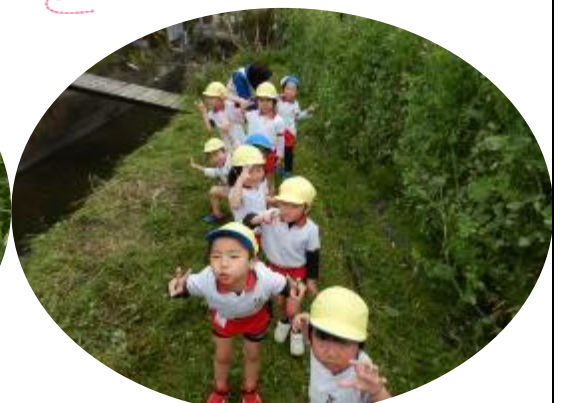
クラス トーキョー・サイホージは、キヌサヤ を収穫しに行きました( )v