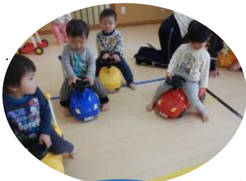
クラス パリ くるまでゴー！ゴー！ たくさん遊ぶぞー(*~*)