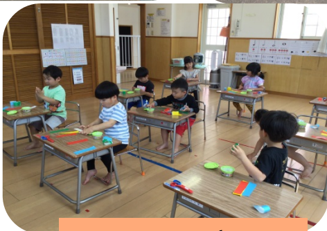
クラス トーキョー