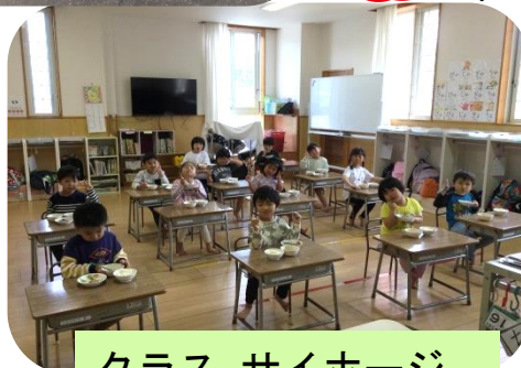
クラス サイホージ